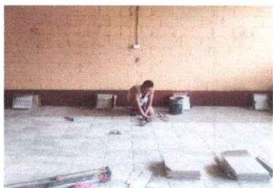
Foto 5: colocacion de piso ceramico en las tres aulas en que se intervino.