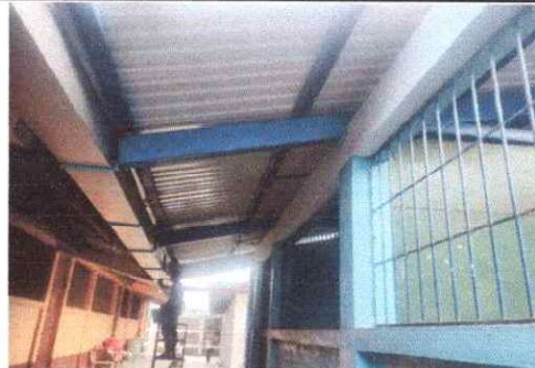
Foto 2: Se realiza el mantenimiento del soporte la estructura, incluyendo lijado, raspado y pintura de cada costanera en las tres aulas.