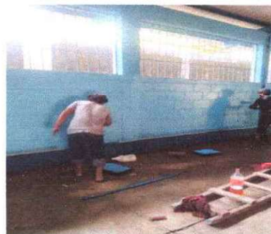
Foto 6: Aplicación de pintura en interior y exterior de las aulas intervenidas

Observación: Si es necesario se pueden agregar hojas adicionales de hojas.