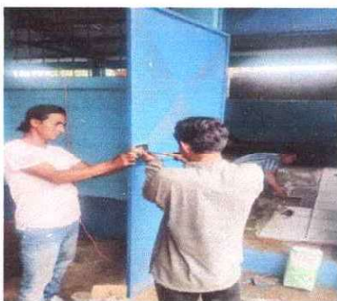
Foto 3: Cambio de chapa de dos puertas y colocacion de chapa en una puerta que no habia.