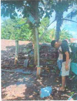
Foto 13: Se observa la modificación del pozo mecánico a eléctrico, se instalará una bomba sumergible de bala.