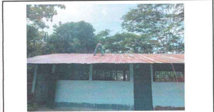
Foto 1: Se observa que se le está dando la aplicación de pintura anticorrosiva a las láminas.