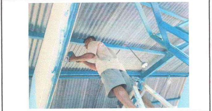
Foto 2: Se observa que está dándole mantenimiento a la estructura metálica.