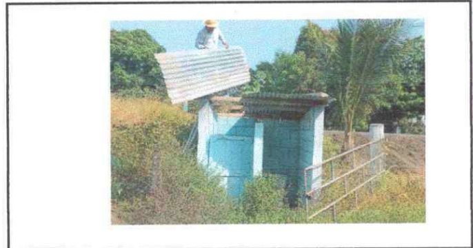
Foto 6: Se puede observar que se está quitando las láminas en mal estado

Observación: Si es necesario se pueden agregar hojas adicionales y actualizar el número de hojas.