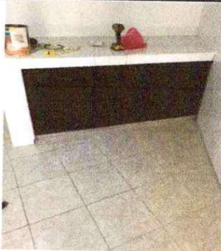
Foto 9: SUSTITUCIÓN DE PISO CERÁMICO: Se observa que el piso está en mal estado.