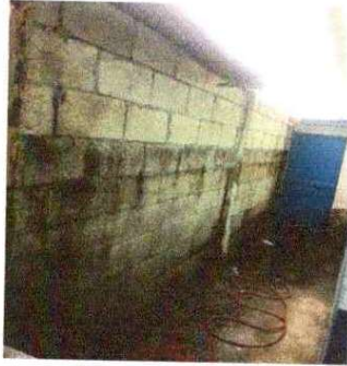
Foto 1: SUSTITUCIÓN DE MURO PERIMETRAL DE BLOCK: Se observa que el muro esta pequeño.