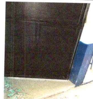
Foto 6: SUSTITUCIÓN DE PUERTA EN AULA: Se observa que estan en mal estado ya se reparo 2 veces.

Observación: Si es necesario se pueden agregar hojas adicionales y actualizar el número de hojas.