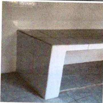
Foto 11: REPARACIÓN Y SUSTITUCIÓN DE AZULEJO: Se observa que está dañado.