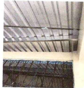
Foto 10: Sustitución de lámina, por lámina troquelada aluzinc calibre 26 (incluye capote, tornillo, desmontaje y montaje): Se observa que las láminas ya tienen agujeros.