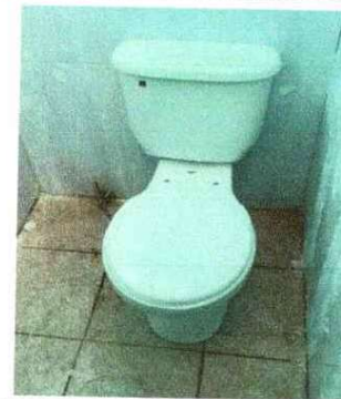
Foto 4: SUSTITUCIÓN DE INODORO (Incluye instalación hidráulica y sanitaria): Se observa que el inodoro se encuentra en mal estado.