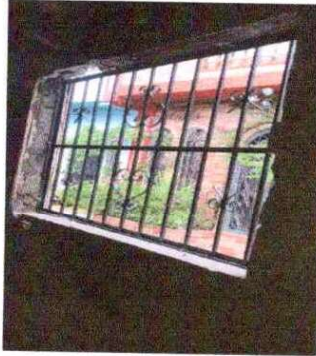
Foto 7: SUSTITUCIÓN DE BALCON DE METAL: Se observa que es pequeño y se hará más grande.