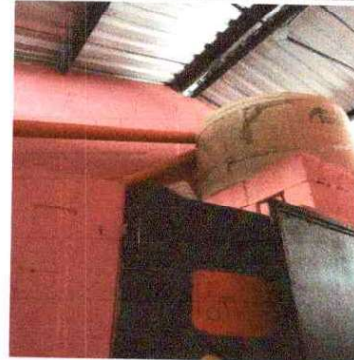
Foto 8: SUSTITUCIÓN DE ACCESORIOS, DEPÓSITO DE AGUA: Se cambia de un lugar a otro por eso son los accesorios.