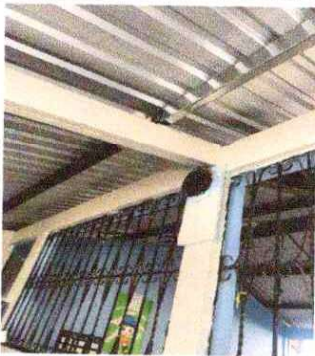
Foto 15: SUSTITUCIÓN DE ESTRUCTURA DE SOPORTE METAL POR METAL: Se observa que ya se encuentra en mal estado.

Observación: Si es necesario se pueden agregar hojas adicionales y actualizar el número de hojas.