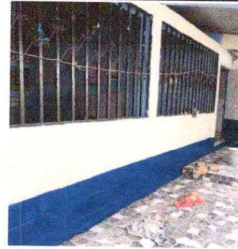
Foto 14: Resane y aplicación de pintura latex acrilica en muros exteriores e interiores (incluye mejora en reformaciones y agujeros) : Se observa que ya esta en mal estado.