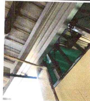
Foto 12: SUSTITUCIÓN DE CANAL DE METAL (INCLUYE BAJADA DE AGUA 3 PULGADAS): Se observa que ya está en mal estado.

Observación: Si es necesario se pueden agregar hojas adicionales, actualizar el número de hojas.