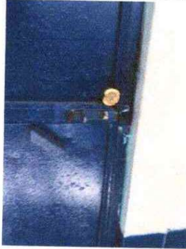
Foto 13: SUSTITUCIÓN DE CHAPA DE PRIMERA CALIDAD: Se observa que no cuenta con chapa.