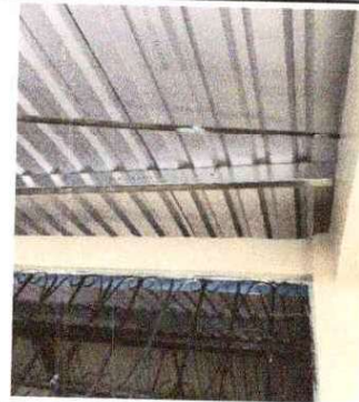
Foto 10: Sustitución de lámina, por lámina troquelada aluzinc calibre 26 (incluye capote, tornillo, desmontaje y montaje): Se observa que las láminas ya tienen agujeros.