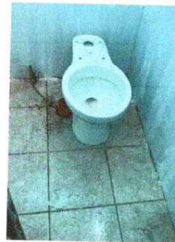
Foto 4: SUSTITUCIÓN DE INODORO (Incluye instalación hidráulica y sanitaria): Se observa que el inodoro se encuentra en mal estado.