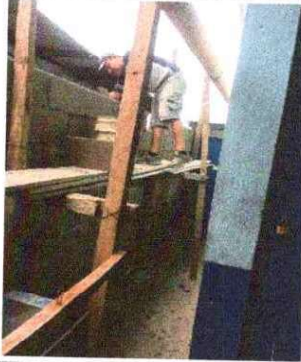
Foto 1: SUSTITUCIÓN DE MURO PERIMETRAL DE BLOCK: Se observa que el muro esta pequeño.