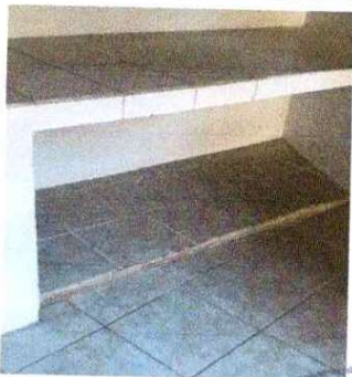
Foto 11: REPARACIÓN Y SUSTITUCIÓN DE AZULEJO: Se observa que está dañado.