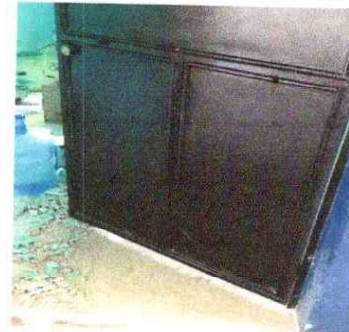
Foto 6: SUSTITUCIÓN DE PUERTA EN AULA: Se observa que estan en mal estado ya se reparo 2 veces.

Observación: Si es necesario se pueden agregar hojas adicionales y actualizar el número de hojas.