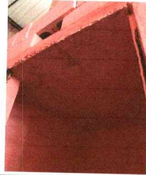
Foto 8: SUSTITUCIÓN DE ACCESORIOS, DEPÓSITO DE AGUA: Se cambia de un lugar a otro por eso son los accesorios.