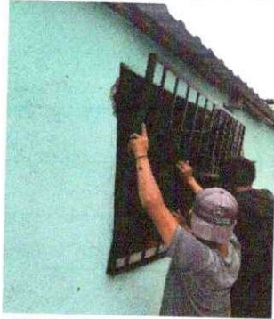
Foto 7: SUSTITUCIÓN DE BALCON DE METAL: Se observa que es pequeño y se hará más grande.