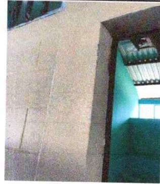
Foto 14: Resane y aplicación de pintura latex acrílica en muros exteriores e interiores (incluye mejora en reformaciones y agujeros) : Se observa que ya esta en mal estado.