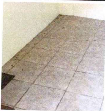
Foto 9: SUSTITUCIÓN DE PISO CERÁMICO: Se observa que el piso está en mal estado.