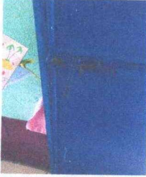
Foto 13: SUSTITUCIÓN DE CHAPA DE PRIMERA CALIDAD: Se observa que no cuenta con chapa.