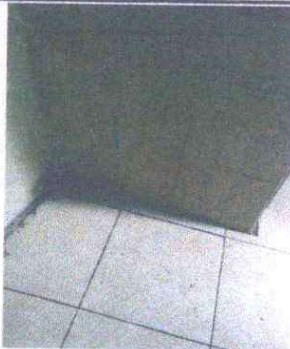
Foto 11: REPARACIÓN Y SUSTITUCIÓN DE AZULEJO: Se observa que está dañado.