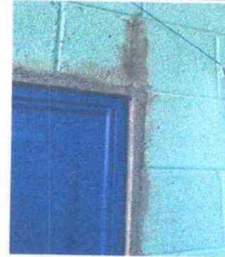
Foto 14: Resane y aplicación de pintura latex acrílica en muros exteriores e interiores (incluye mejora en reformaciones y agujeros) : Se observa que ya esta en mal estado.