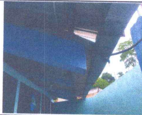
Foto 10: Sustitución de lámina, por lámina troquelada aluzinc calibre 26 (incluye capote, tornillo, desmontaje y montaje): Se observa que las láminas ya tienen agujeros.