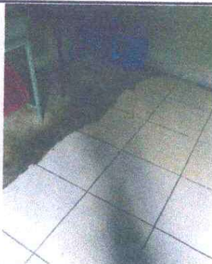
Foto 9: SUSTITUCIÓN DE PISO CERÁMICO: Se observa que el piso está en mal estado.