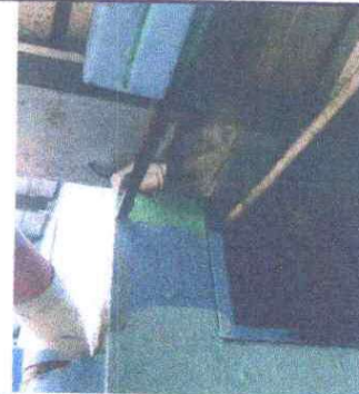
Foto 12: SUSTITUCIÓN DE CANAL DE METAL (INCLUYE BAJADA DE AGUA 3 PULGADAS): Se observa que ya está en mal estado.

Observación: Si es necesario se pueden agregar hojas adicionales y actualizar el número de hojas.