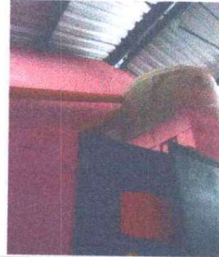
Foto 8: SUSTITUCIÓN DE ACCESORIOS, DEPÓSITO DE AGUA: Se cambia de un lugar a otro por eso son los accesorios.