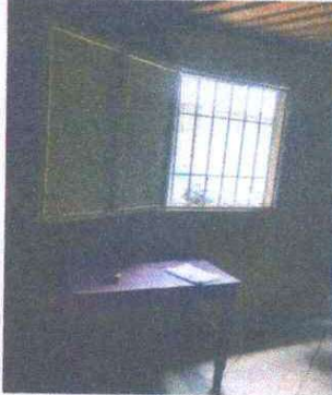
Foto 7: SUSTITUCIÓN DE BALCON DE METAL: Se observa que es pequeño y se hará más grande.