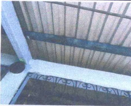
Foto 15: SUSTITUCIÓN DE ESTRUCTURA DE SOPORTE METAL POR METAL: Se observa que ya se encuentra en mal estado.

Observación: Si es necesario se pueden agregar hojas adicionales y actualizar el número de hojas.