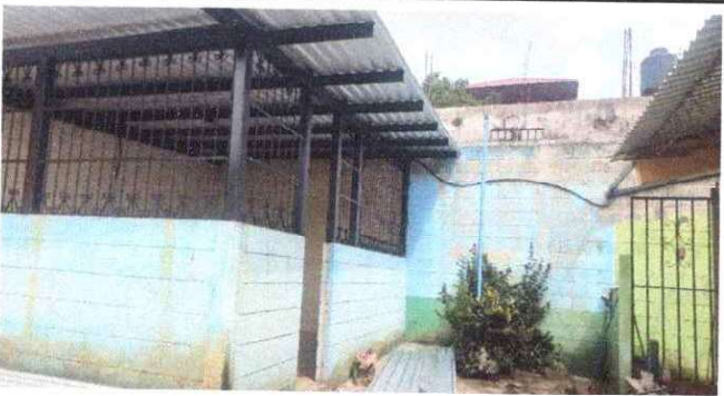
Foto 3: Sustitución de balcon de madera por metal el aula no cuenta con seguridad, por lo que han ingresado a robar en varias oportunidades.