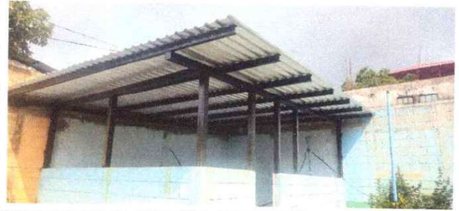
Foto 2: Sustitución de estructura de madera por metal, la madera esta demasiada deteriorada.