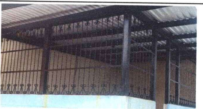
Foto 4: Resane y aplicación de pintura las paredes estan muy manchadas y no reflejan un ambiente agradable.

Observación: Si es necesario se pueden agregar hojas adicionales y actualizar el número de hojas.