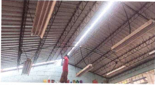
Foto 1: Sustitución de lámina troquelada calibre 26"aluzinc , la lámina tiene demasiada filtración de agua.