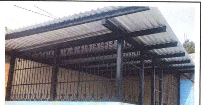
Foto 4: Resane y aplicación de pintura las paredes estan muy manchadas y no reflejan un ambiente agradable.