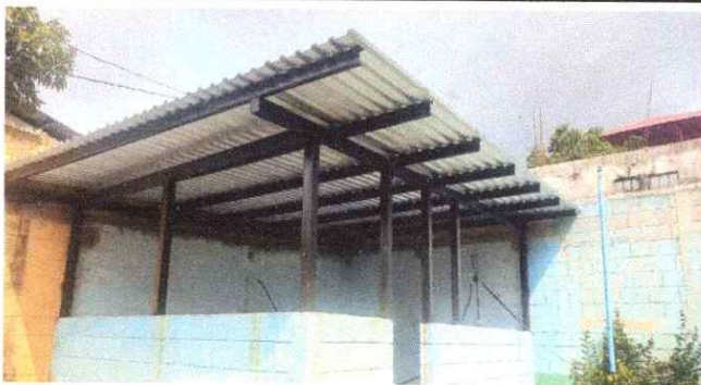
Foto 3: Sustitución de balcon de madera por metal el aula no cuenta con seguridad, por lo que han ingresado a robar en varias oportunidades.