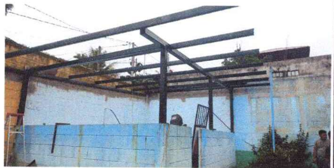
Foto 2: Sustitución de estructura de madera por metal, la madera esta demasiada deteriorada.