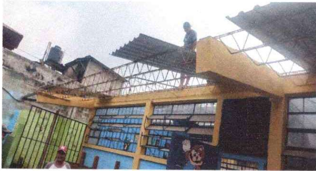
Foto 1: Sustitución de lámina troquelada calibre 26"aluzinc , la lámina tiene demasiada filtración de agua.