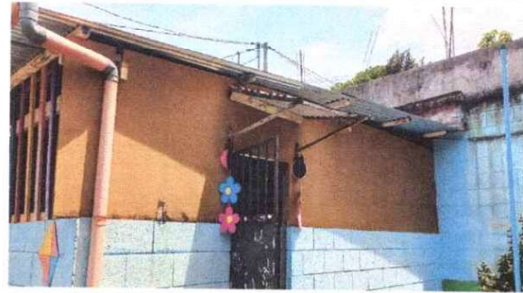
Foto 4: Resane y aplicación de pintura las paredes estan muy manchadas y no reflejan un ambiente agradable.

Observación: Si es necesario se pueden agregar hojas adicionales y actualizar el número de hojas.