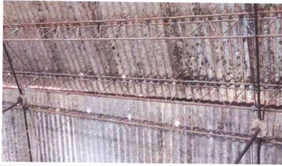
Foto 1: Sustitución de lámina troquelada calibre 26"aluzinc , la lámina tiene demasiada filtración de agua.