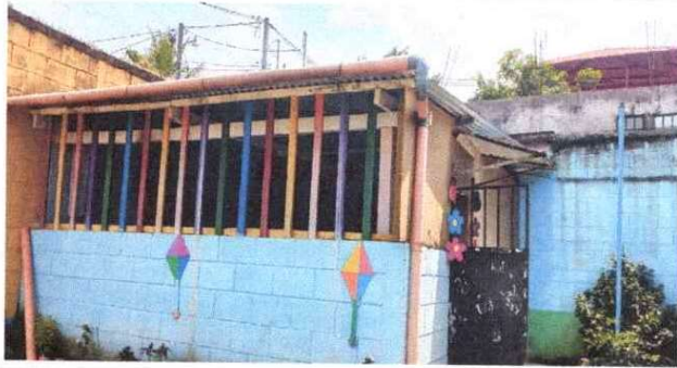
Foto 3: Sustitución de balcon de madera por metal el aula no cuenta con seguridad, por lo que han ingresado a robar en varias oportunidades.