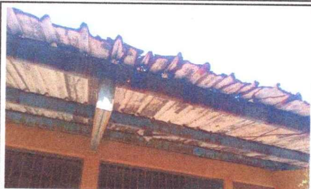
Foto2: SE OBSERVA QUE LAS COSTANERAS CON PINTURA DETERIORADA.