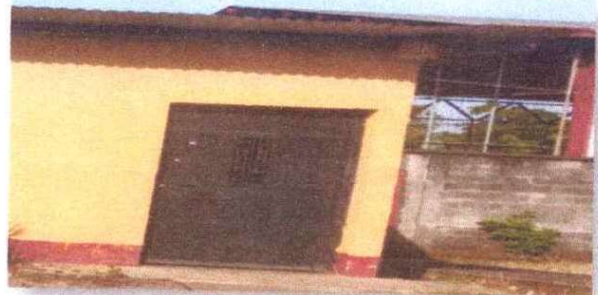
Foto 4: SE OBSERVA QUE LA PUERTA SE ENCUENTRA EN LA ESTADO CON OXIDO Y PINTURA EN MAL ESTADO