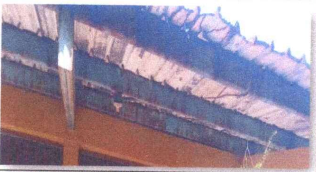
Foto3: SE OBSERVA QUE LAS COSTANERAS CON PINTURA DETERIORADA.