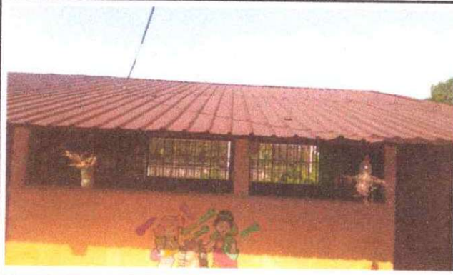
Foto1: SE OBSERVA QUE LAS LAMINAS ESTAN EN MAL ESTADO