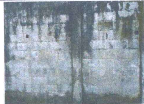
Foto 6: Sustitución de muro perimetral de block: Se puede observar que el muro tiene grietas y mucha porosidad.

Observación: Si es necesario se pueden agregar hojas adicionales y actualizar el número de hojas.