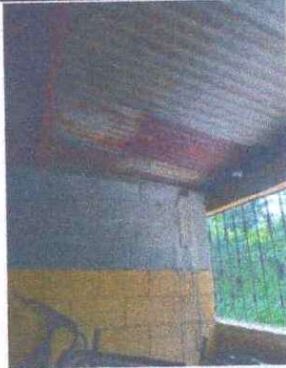
Foto 1: Sustitución de lamina troquelada calibre 26: Se observa que las laminas estan muy picadas entra demasiada agua.