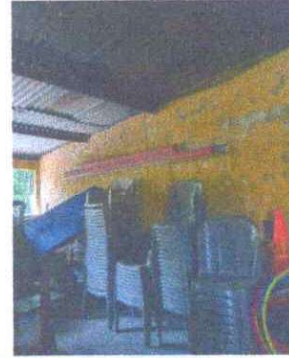
Foto 8: Mantenimiento estructura de soporte de metal: Se observa que la estructura tiene mucho oxido.