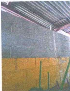
Foto 5: Cernido de muro: Se observa que falta una parte del muro que no esta cernido.