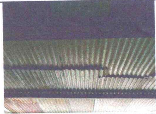
Foto 2: Sustitución de estructura de metal por metal: Se observa que las costaneras estan muy oxidadas y muy picadas.