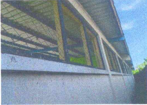
Foto 7: Sustrucción de canal de metal: Se observa que el canal esta en partes quebradas.