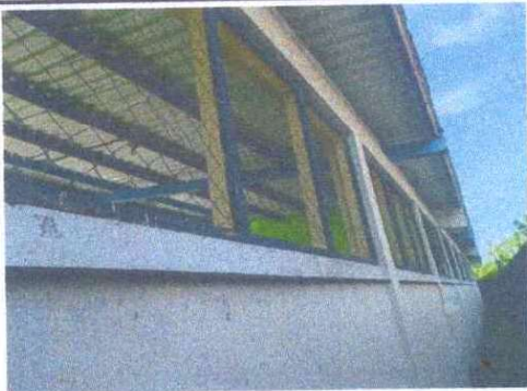
Foto 3: Sustitución de balcones de metal: Se observa que estan picados por oxido.