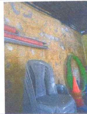
Foto 4: Repello de muro: Se observa que no tiene repello la pred y tiene mucha humedad.