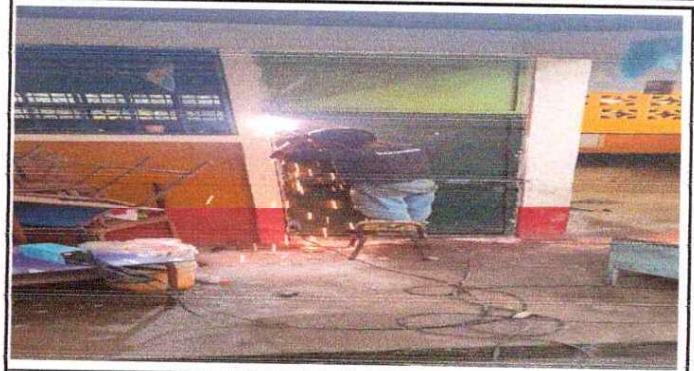
Foto 2: Las puertas estan dañadas en la parte inferior y se dificulta abrilas