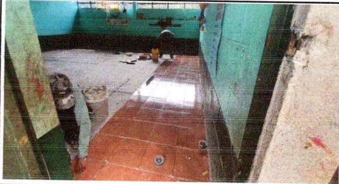
Foto 1: El suministro de piso ceramico le dara un mejor entorno a las aulas por a las gritetas que estan en el piso de cemento