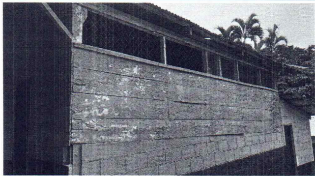
Foto 1: SE OBSERVA QUE EL AULA YA NO TIENE LAS CONDICIONES ADECUADAS PARA RECIBIR CLASES