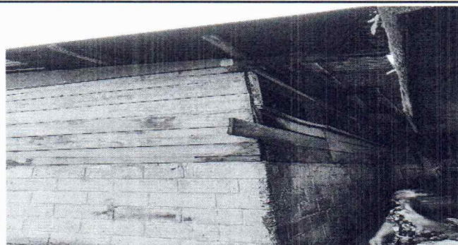
Foto 3: SE OBSERVA QUE LA LAMINA QUE SE ENCUETRA COLOCADA YA NO ESTA EN FUNCIONAMIENTO ADECUADO