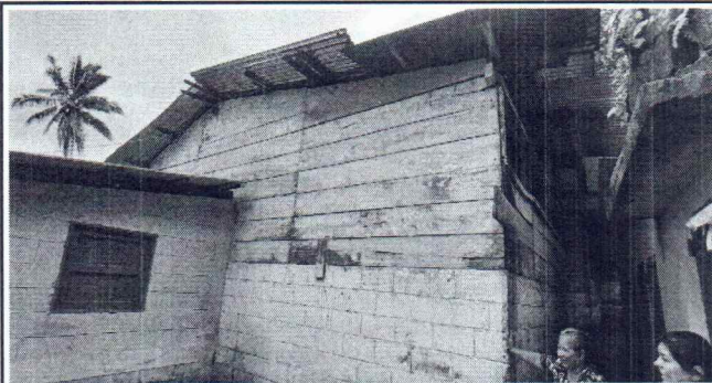
Foto 4: SE OBSERVA QUE LA LAMINA QUE SE ENCUETRA COLOCADA YA NO ESTA EN FUNCIONAMIENTO ADECUADO