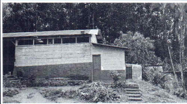
Foto 2: SE OBSERVA QUE LA ESTRUCTURA DE SOPORTE YA NO ESTA EN CONDICIONES PARA SU USO