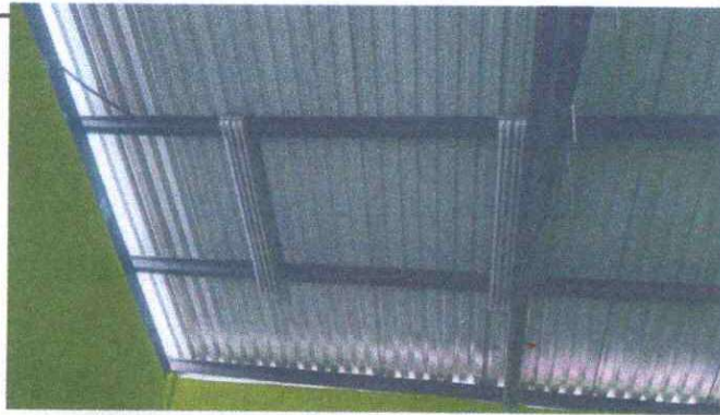
Foto 9: MÓDULO 3 (1.11.Falta de iluminación y cables en mal estado.)