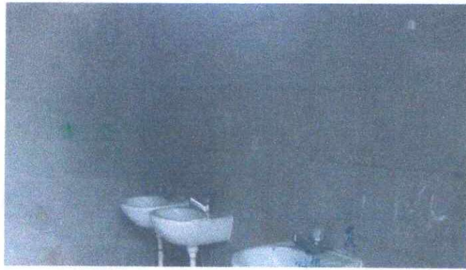
Foto 7: (1.8.Paredes en el área de baños complicadas para su ornato.)