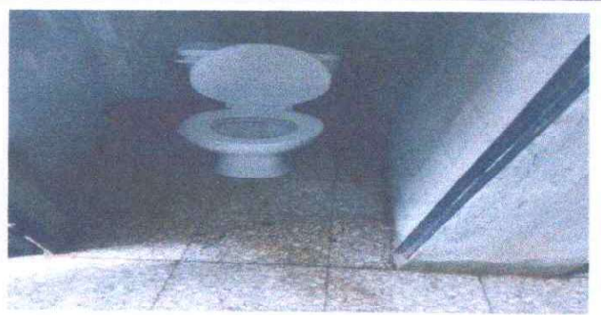
Foto 4. MÓDULO 2 (1.5.Inodoros en mal estado con fuga hidráulica.)