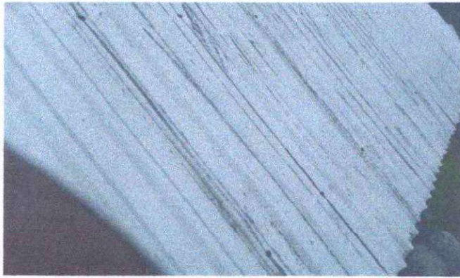
Foto1: MÓDULO 1 (1.1.Láminas en mal estado.)