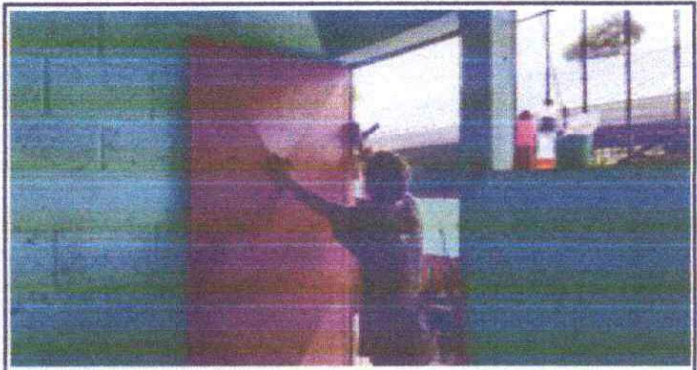
Foto 4: las puertas ya requieren mantenimiento la pintura ya esta en malas condiciones