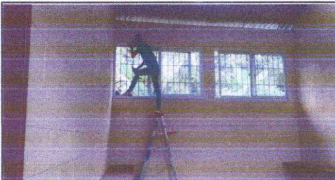
Foto 3: En los balcones esta sujetado cortinas para que la briza de agua no entre al laboratorio de computacion