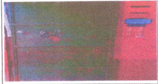
Foto 4: Las puertas ya requieren mantenimiento; la pintura ya está en malas condiciones