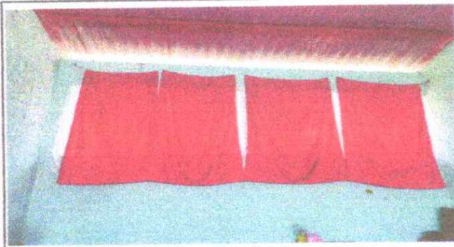
Foto 3: En los balcones están sujetadas cortinas para que la brisa de agua no entre al laboratorio de computación