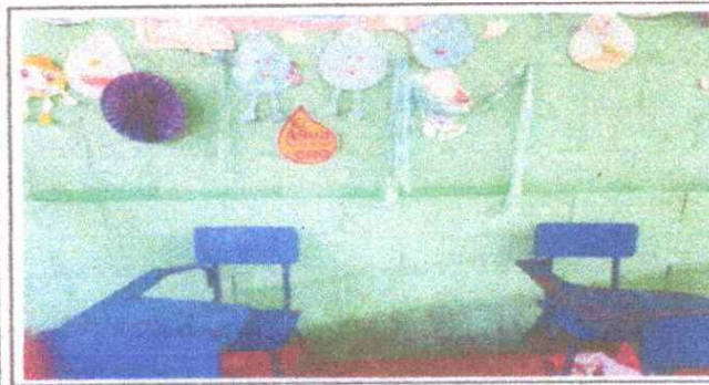
Foto 5: La pintura no tiene el mismo color fuerte en toda la pared

Observación: Si es necesario se pueden agregar hojas adicionales y actualizar el número de hojas.