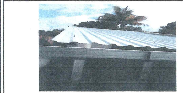
Foto 3: Sustitucion de estructuras de metalica y lamina troquelada