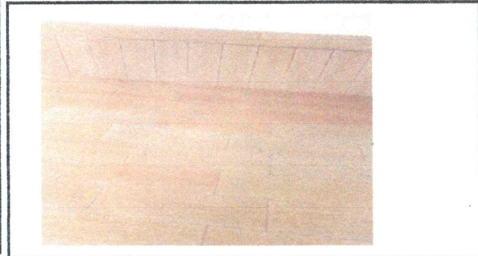
Foto1: Suministro de piso ceramico