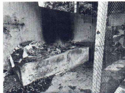
Foto 6: se observa el mal estado de cocina, urge la reparacion del mismo.

Observación: Si es necesario se pueden agregar hojas adicionales, indicando el número de hojas.