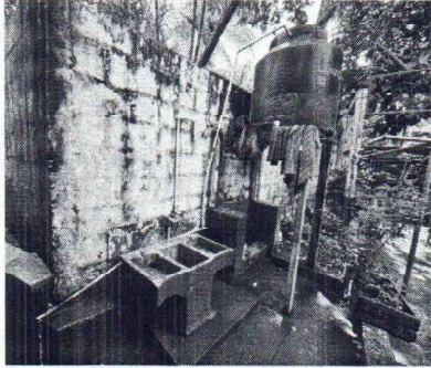
Foto 1: Se observa un deposito de agua el cual se encuentra sin uso por el mal estado.