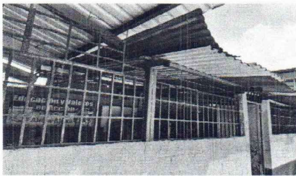
Foto 5: Se observa el mal estado del techo y balcones, urge sustitucion de laminas y balcones