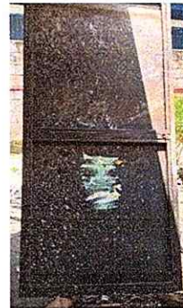
Foto 10: Se observa que las puertas se desmontaron para poder repararlas.