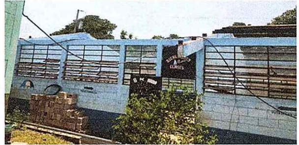
Foto 8: Se observa el desmontaje de costaneras oxida, juntamente con laminas.