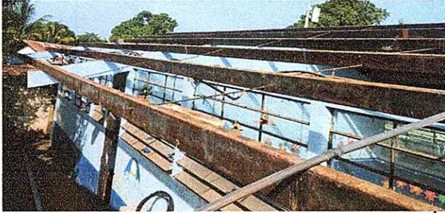
Foto 7: se observa el techado sin lamina y las costaneras están muy oxidadas , no se pueden reparar.