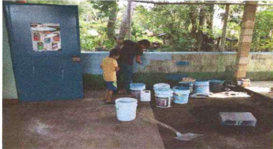
FOTO 13: Se observa que se esta aplicando pintura en la pared de muro perimetral .

Observación: Si es necesario se pueden agregar hojas adicionales y actualizar el número de hojas.