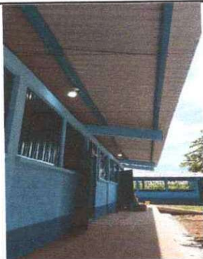
FOTO 1: Se observa que los trabajos de instalacion de piso ceramico se estan realizando