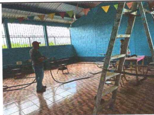
FOTO 4: Se observa que los trabajos de instalacion del tendido electrico en modulo de aulas se esta realizando.