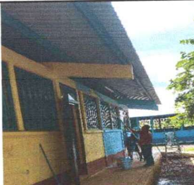
FOTO 2: Se observa que se aplicando pintura exterior en pared de aula.