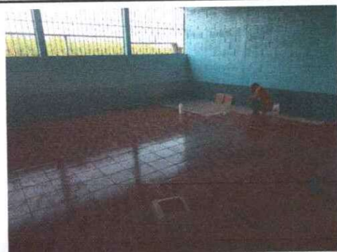
Foto 5: Se observa que los trabajos de instalacion de piso ceramico se estan realizando.