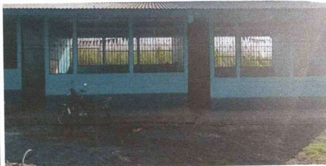
FOTO 6: Se observa que las puertas de aula se le esta dando el mantenimiento requerido.

Observación: Si es necesario se pueden agregar hojas adicionales y actualizar el número de hojas.