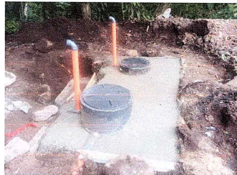
Foto 10: Se observa biodigestores y pozo de absorción instalados.