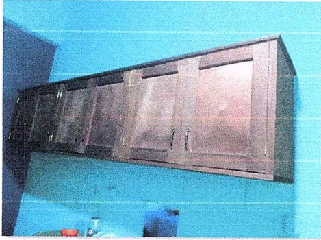
Foto 7: Se observa gabinetes para mejoras de la cocina instalados.