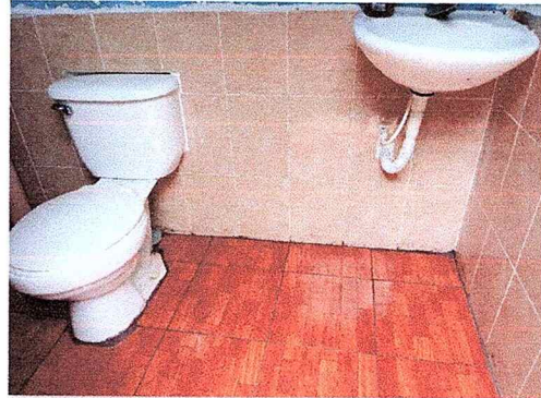
Foto 8: Se observa piso ceramico, azulejo y accesorios en el lavamanos instalados.