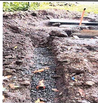
Se observa zanja de absorción tipo frances.

Observación: Si es necesario se pueden agregar hojas adicionales y actualizar el número de hojas.