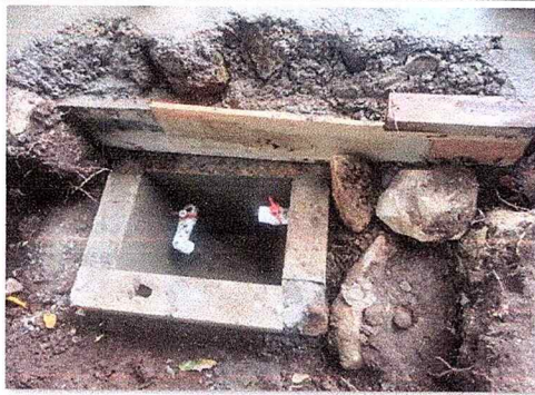
Se observa caja de registro de absorción instalado.