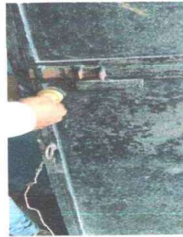
Foto 4: Se procede a realizar el cambio de la chapa en mal estado.