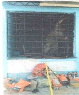
Foto 6: Se procede a realizar la sustitución del balcon de la cocina.

Observación: Si es necesario se pueden agregar hojas adicionales y actualizar el número de hojas.