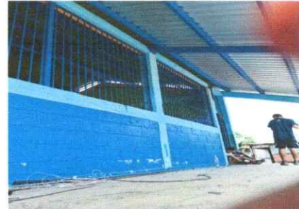
Foto 2: Se realizó el cambio de la estructura de soporte de la lámina.