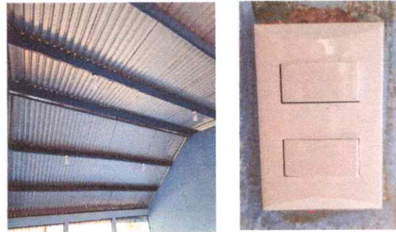
FOTO 2: Instalación de sistema eléctrico, focos e interruptores en cada uno de los salones de clases.