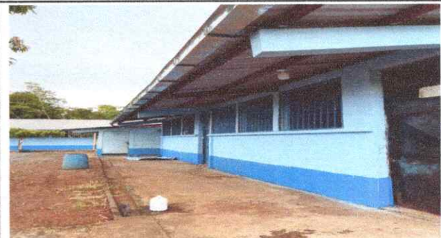
FOTO 4: Canal de metal con su respectiva caída de agua, instalado.