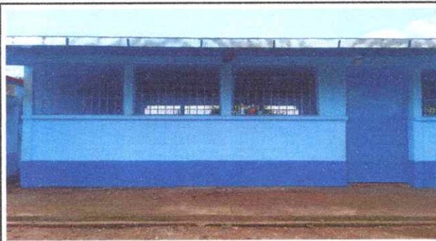
FOTO 3: Se observa la aplicación de pintura en las paredes de las distintas aulas de la escuela.