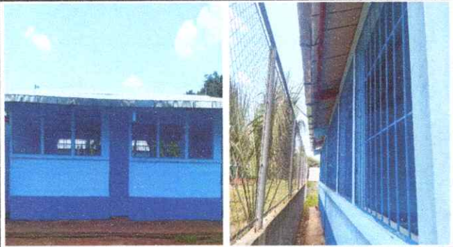
FOTO 1: Balcones instalados en el módulo 1. Balcon de metal por metal.