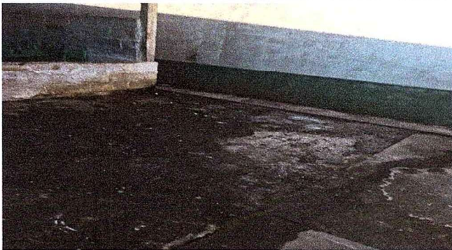
Foto 9: Se observa que ya están preparando el espacio para realizar la plancha de concreto que se encuentra en mal estado.