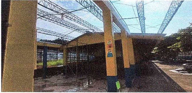
Foto 1: Se observa que la lámina ya fue desmontada para realizar el cambio