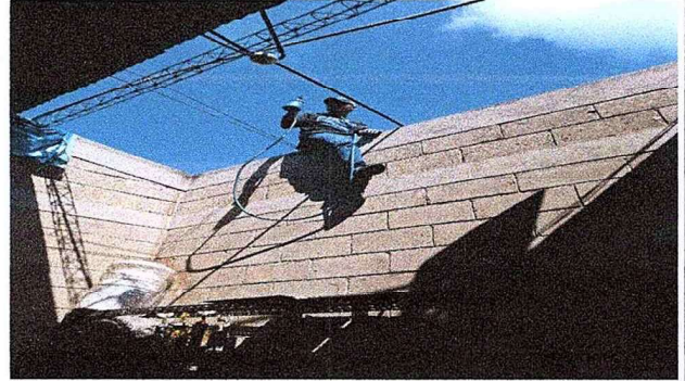
Foto 2: Se observa estructura de soporte de metal está recibiendo su mantenimiento.