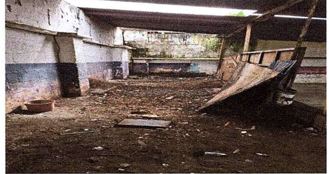
Foto 8: Se observa que ya están preparando el espacio para tirar torta de concreto.