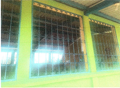
Foto 7: Se observa que los balcones necesitan mantenimiento en su estructura y deben ser asegurados ya que están sobrepuestos.