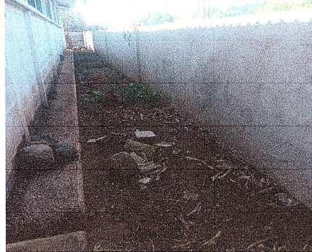
Foto 2: El muro perimetral de la parte trasera esta bajo, por lo que necesita aumentar la altura, se considera que es necesario agregar 2 hiladas de block más.