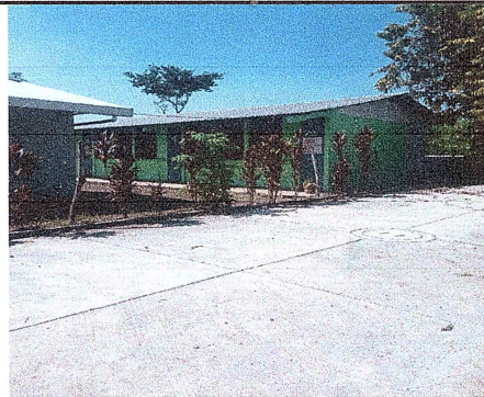
Foto 6: Se contempla dejar una salida de emergencia en el lado donde se colocará el muro prefabricado.

Observación: Si es necesario se pueden agregar hojas adicionales y actualizar el número de hojas.