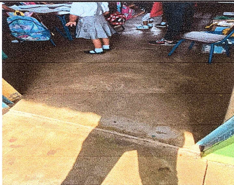
Foto 9: Las aulas solamente tienen una torta alisada, se le colocará piso cerámico.

Observación: Si es necesario se pueden agregar hojas adicionales y actualizar el número de hojas.