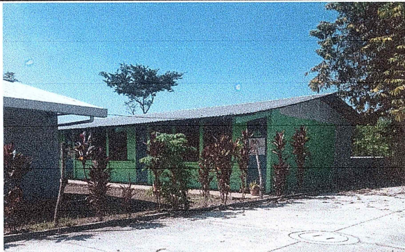
Foto 1: Se observa que en este lado no hay muro perimetral, por seguridad de los niños se debe colocar muro prefabricado.