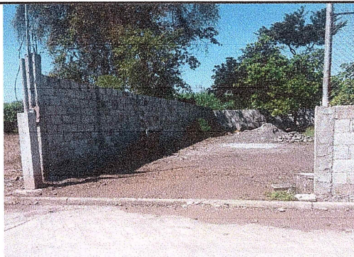
Foto 5: El centro educativo necesita un portón en la entrada principal debido a que carece del mismo.