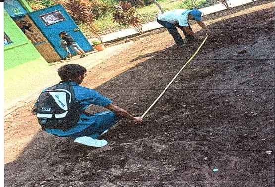
Foto 8: Se verifica que los niños no cuentan con un espacio recrearse, por lo que se realizará una plancha de concreto en el patio.