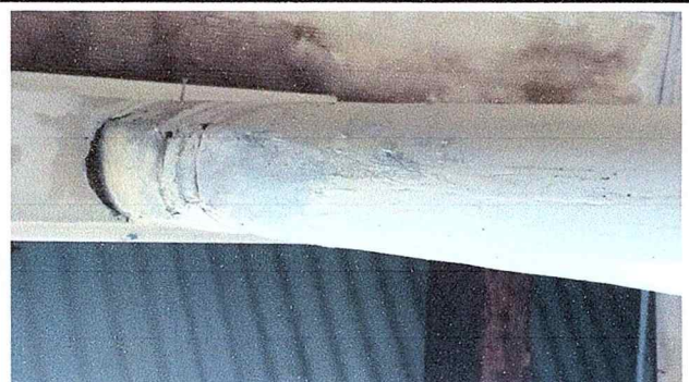
Se realizó el resane y aplicó pintura a los pilares del corredor.

Observación: Si es necesario se pueden agregar hojas adicionales y actualizar el número de hojas.