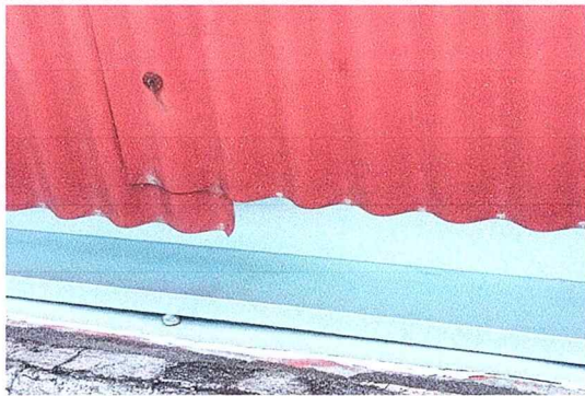
Se observa el cambio de láminas y canales nuevos.