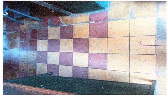
Se realizó el cambio de piso.