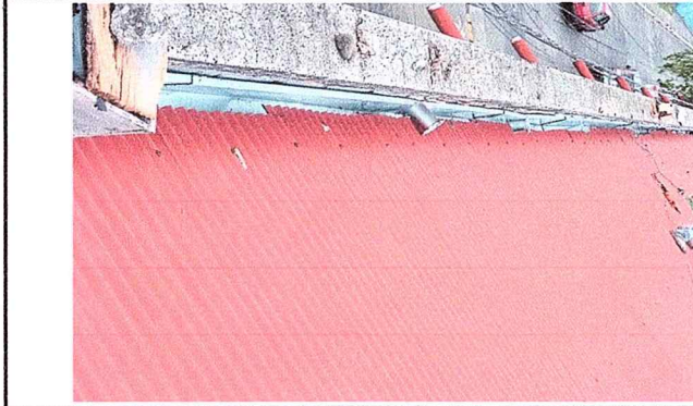
Se observa el cambio de canales, acción que se realizó en los módulos 1 y 4 .