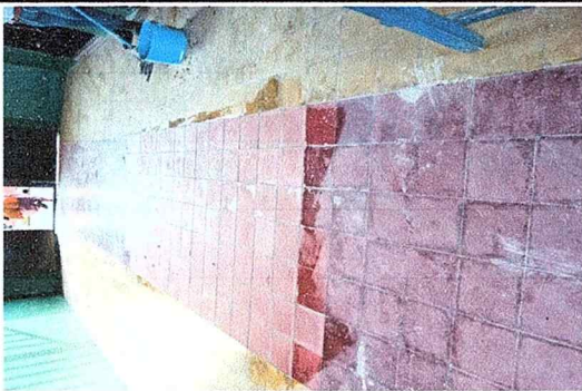
Se niveló y realizó cambio de piso