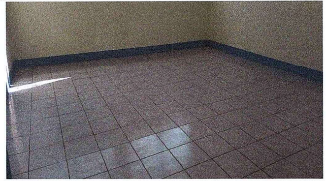
FOTO 2: SE OBSERVA LA FINALIZACIÓN DE LA INSTALACIÓN DE PISO CERÁMICO.