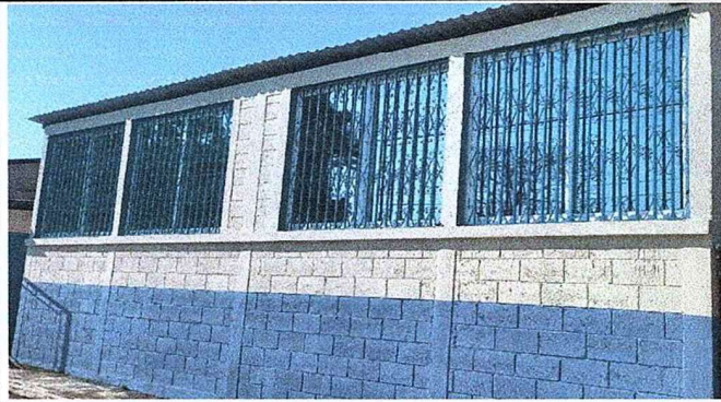
Foto 1: SE OBSERVA LA FINALIZACIÓN DE LA INSTALACIÓN DE VENTANAS DE PVC.