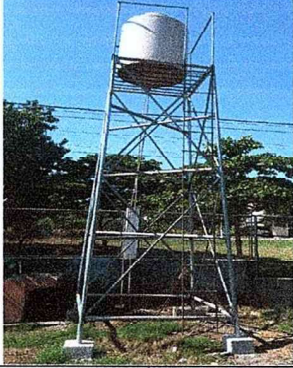
Foto 7: SE OBSERVA LA FINALIZACIÓN DE LA CONSTRUCCIÓN DE TORRE DEL DEPÓSITO DE AGUA.

Observación: Si es necesario se pueden agregar hojas adicionales y actualizar el número de hojas.