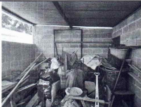
FOTO 11: SE OBSERVA EL DETERIORO DE LAS PAREDES DE BLOCK POR FALTA DE REPELLO Y CERNIDO.