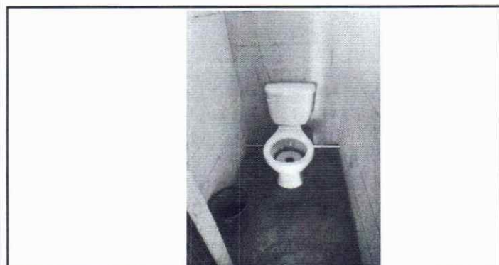
FOTO 5: SE OBSERVA EL MAL ESTADO DE LOS BAÑOS Y LO SUCIO DE LAS PAREDES POR FALTA DE AZULEJO.