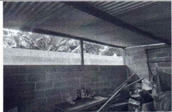
FOTO 10: SE OBSERVA LA MALLA OXIDADA Y LA FALTA DE ELEVACIÓN DEL MURO.