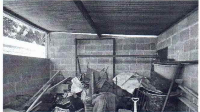
FOTO 8: SE OBSERVA EL DETERIORO DE LÁMINAS Y ESTRUCTURA DE SOPORTE QUE ES DE MADERA, URGE SUSTITUCIÓN.