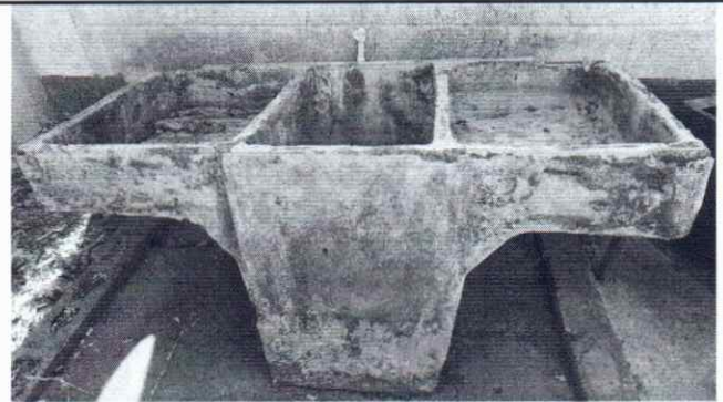
FOTO 12: SE OBSERVA EL DETERIORO DEL CONCRETO DE LA PILA Y LA FALTA DE CHORRO.

Observación: Si es necesario se pueden agregar hojas adicionales y actualizar el número de fotos.