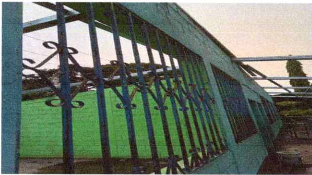
FOTO 3: SE OBSERVA QUE SE EMPIEZA LA COLOCACION DE LA ESTRUCTURA METALICA POR MADERA.