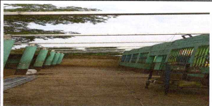
FOTO 6 : SE OBSERVA COMO ESTAN COLOCANDO LAS BIGAS DE LA ESTRUCTURA METALICA.

Observación: Si es necesario se pueden agregar hojas adicionales y actualizar el número de hojas.