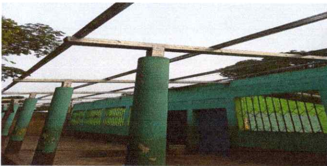
FOTO 5: SE OBSERVA COMO ESTA QUEDANDO LA COLOCACION DE LA ESTRUCTURA METALICA.