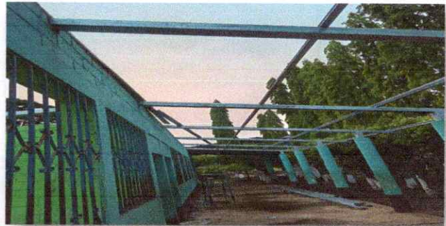
FOTO 4 : SE OBSERVA QUE ESTAN COLOCANDO LA ESTRUCTURA METALICA EN EL MODULO DE AULA.