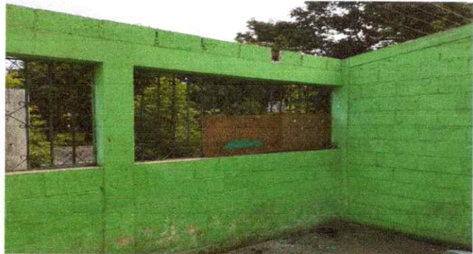
FOTO 1: SE OBSERVA QUE SE HA QUITADO TOTALMENTE EL TECHO DEL MODULO DEL AULA.