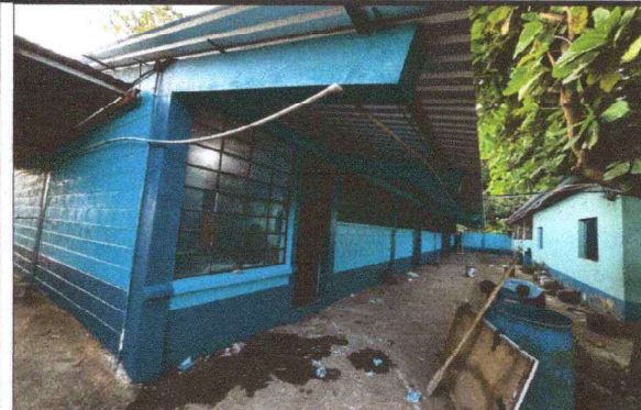
Foto 2: SE OBSERVA QUE LA ESTRUCTURA METALICA DE MODULO DE AULA SE LE DIO EL MANTENIMIENTO REQUERIDO SE FINALIZO EL TRABAJO.