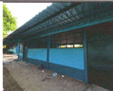
Foto 6: SE OBSERVA QUE SE APLICO PINTURA A INTERIOR Y EXTERIOR DE AULAS, SE TERMINO EL TRABAJO.

Observación: Si es necesario se pueden agregar hojas adicionales y actualizar el número de hojas.