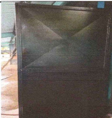
Foto 3: SE OBSERVA QUE LAS PUERTAS DE AULAS SE LE DIO EL MANTENIMIENTO REQUERIDO Y SE TERMINARON LOS TRABAJOS.