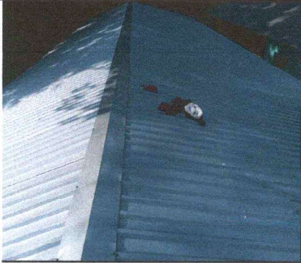
Foto 1: SE OBSERVA QUE LA COLOCACION DE LAMINA TROQUELA ALUZINC CALIBRE 26 LOS TRABAJOS FUERON TERMINADOS