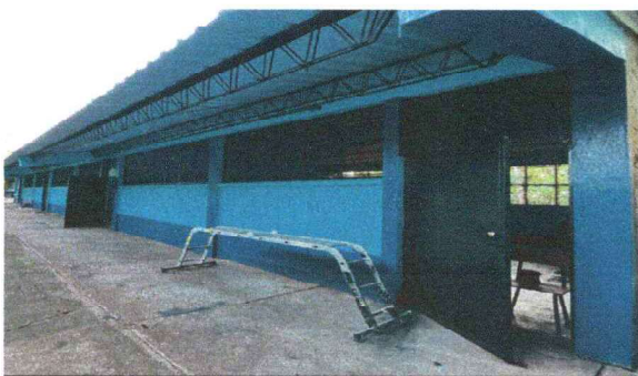
Foto 5: SE OBSERVA QUE SE LE DIO EL MANTENIMIENTO REQUERIDO A LOS BALCONES DE AULAS SE CULMINO EL TRABAJO.