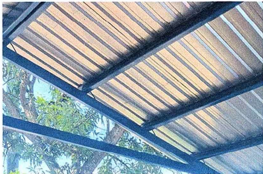
Foto 7: Se observa la finalización de los trabajos de las láminas.