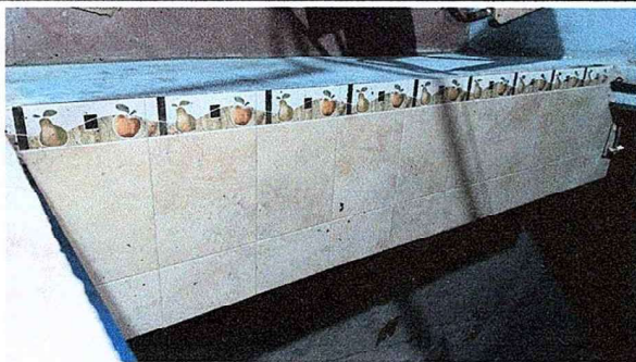
Foto 5: Se observa la finalización de los trabajos en el mueble de cocina.