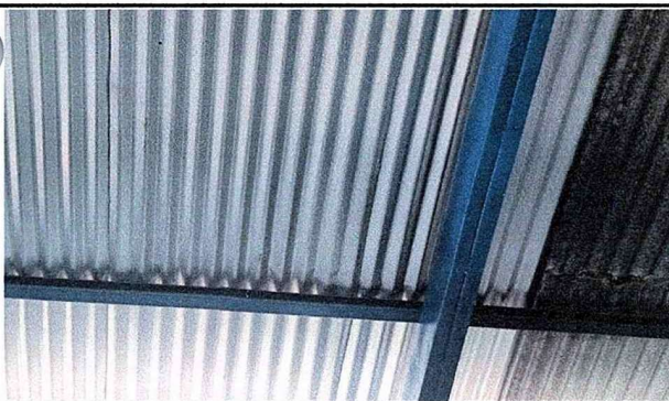
Foto 11: Se observa la finalización de los trabajos de la estructura.

Observación: Si es necesario se pueden agregar hojas adicionales y actualizar el número de hojas.