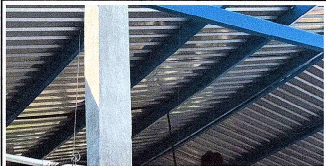
Foto 6: Se observa la finalización de los trabajos en la estructura.

Observación: Si es necesario se pueden agregar hojas adicionales y actualizar el número de hojas.