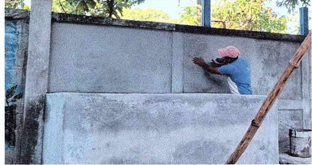
Foto 2: Se observa el proceso de los trabajos de humedad en el muro y repello.