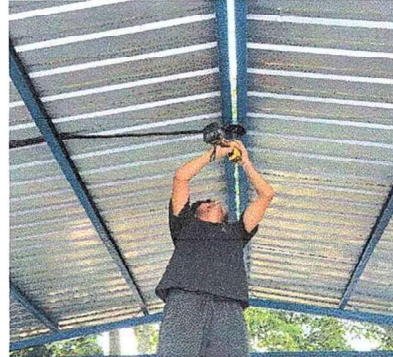
Foto 8: Se observa el proceso de los trabajos del sistema eléctrico.