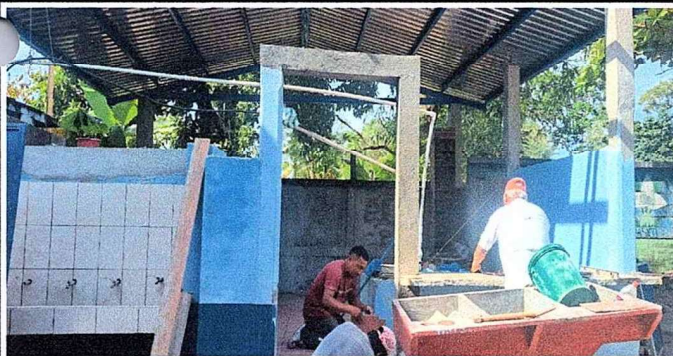
Foto 5: Se observa el proceso de los trabajos del mueble de cocina.