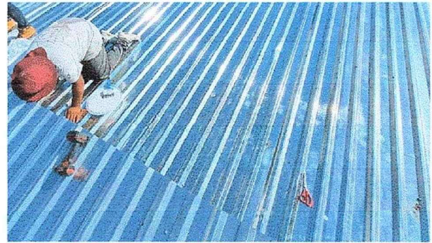
Foto 10: Se observa el proceso del trabajos de cambio de láminas.