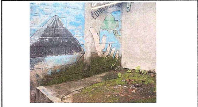
Foto 2: Se observa humedad en el muro y que no cuenta con repello.