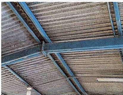
Foto 11: Se observa que se requiere mantenimiento a la estructura

Observación: Si es necesario se pueden agregar hojas adicionales y actualizar el número de hojas.