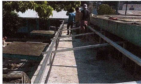
Foto 6: Se observa la finalización de estructura en los ventanales del salón de usos múltiples.

Observación: Si es necesario se pueden agregar hojas adicionales y actualizar el número de hojas.