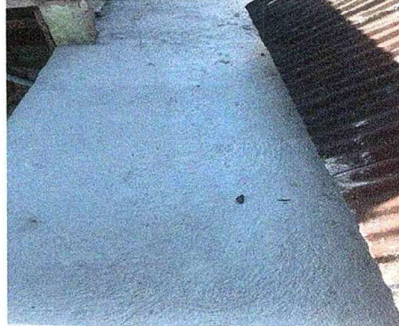
Foto 2: Se observa la finalización de impermeabilización de losa en la parte de arriba del salón de usos múltiples.