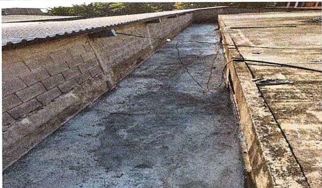
Foto 1: Se observa la finalización de los pañuelos en la parte de arriba del salón de usos múltiples.