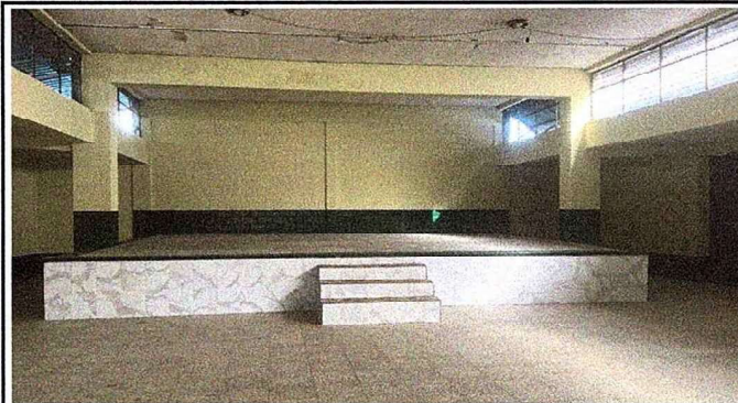
Foto 4: Se observa la finalización de piso cerámico del escenario en el salón de usos múltiples.