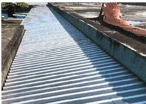
Foto 5: Se observa la finalización lámina troquelada en los ventanales del salón de usos múltiples.