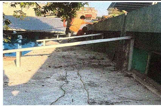
Foto 6: Se observa el proceso de cambio de estructura en los ventanales del salón de usos múltiples.

Observación: Si es necesario se pueden agregar hojas adicionales y actualizar el número de hojas.