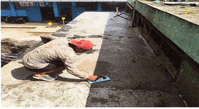
Foto 1: Se observa el proceso de trabajo de los pañuelos en la parte de arriba del salón de usos múltiples.