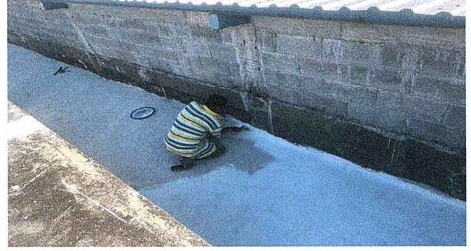
Foto 2: Se observa el proceso de trabajo de impermeabilización de losa en la parte de arriba del salón de usos múltiples.