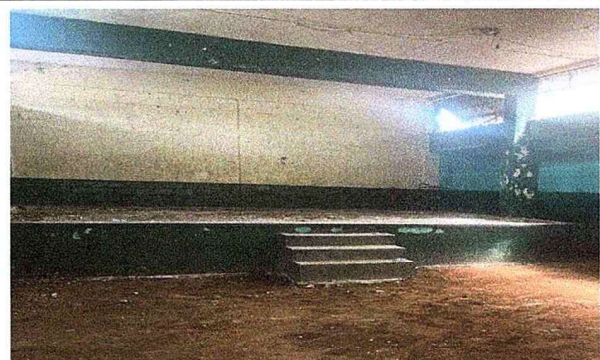
Foto 4: Se observa el proceso de los trabajos de piso del escenario en el salón de usos múltiples.