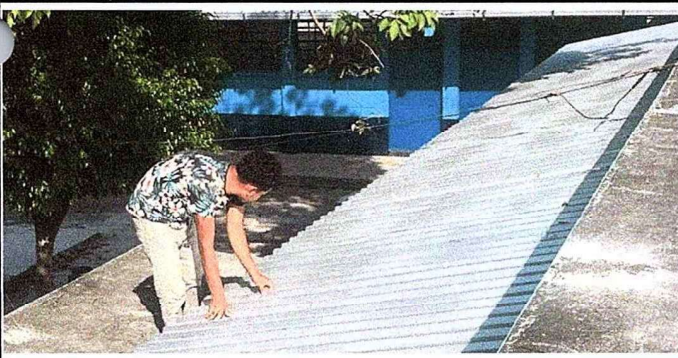
Foto 5: Se observa el proceso de cambio de lámina en los ventanales del salón de usos múltiples.