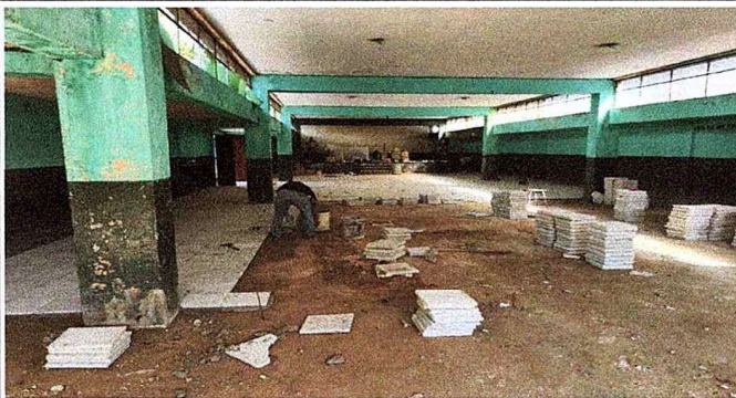
Foto 3: Se observa el proceso de sustitución de piso en el salón de usos múltiples.