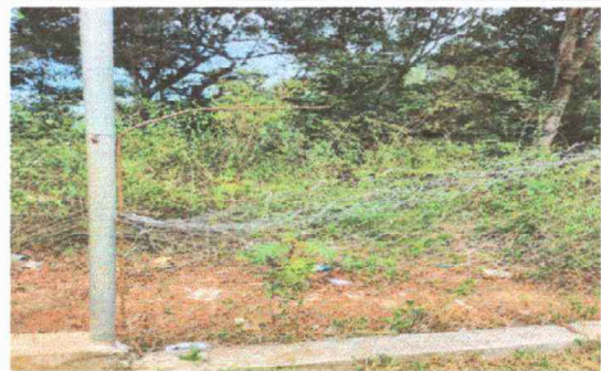
Reparacion de muro périmetral

Observación: Si es necesario se pueden agregar hojas adicionales y actualizar el número de hojas.