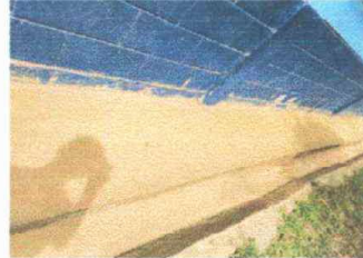
Modulo 1: Pintura en muros exteriores e interiores