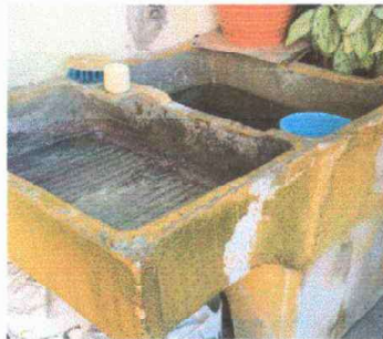
Modulo 1: Sustitución de Lavamanos y sustitucion de Pila de cemento