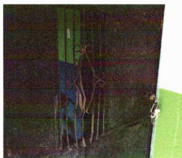
Foto 5: Modulo 1: Mantenimiento a estructura de puerta (lijado, cambio de tubo, cepillado, sujeciones, aplicación de pintura)