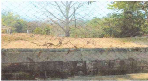
Foto 9: Muro Perimetral: Reparación de muro primetral de block con tubo hg y malla galvanizada , soreras intermedias y columnas

Observación: Si es necesario se pueden agregar hojas adicionales y actualizar el número de hojas.