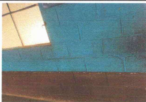
Foto 5: Pintura General: Pintura en muros exteriores e interiores