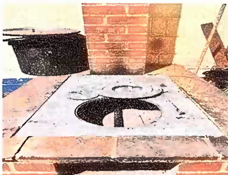
Foto 5: Modulo 2: Sustitución de estufa rural (completa) incluye chimenea y plancha de metal

Observación: Si es necesario se pueden agregar hojas adicionales y actualizar el número de hojas.