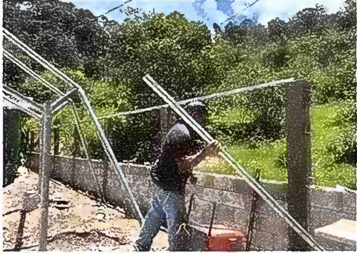
Foto 1: Modulo 1: Reparación de muro perimetral de block con tubo hg y malla galvanizada, soleras intermedias y columnas