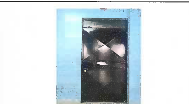
Foto 4: Modulo 1: Mantenimiento a estructura de puerta (lijado, cambio de tubo, cepillado, sujeciones, aplicación de pintura)