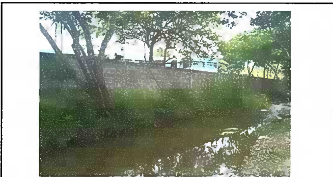
Foto 5: Modulo 2: Reparación de muro perimetral de block con tubo hg y malla galvanizada, soleras intermedias y columnas