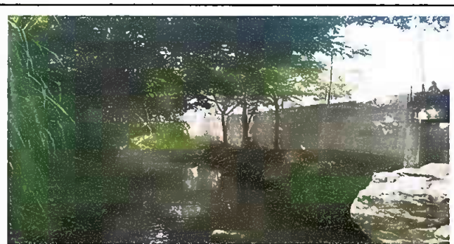
Foto 6: Modulo 2: Reparación de muro perimetral de block con tubo hg y malla galvanizada, soleras intermedias y columnas

Observación: Si es necesario se pueden agregar hojas adicionales y actualizar el número de hojas.