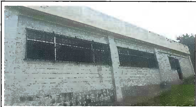
Foto 3: Modulo 1: Fabricación e instalación de balcon de hierro en ventana