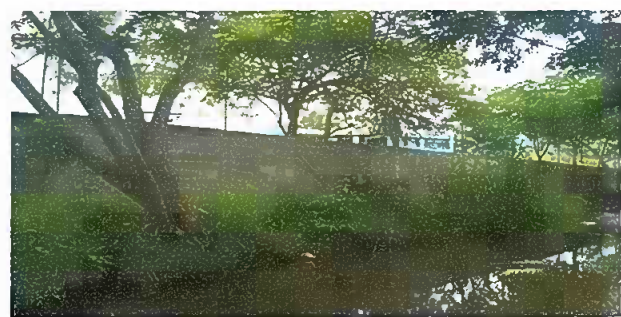
Foto 6: Modulo 2: Reparación de muro perimetral de block con tubo hg y malla galvanizada, soleras intermedias y columnas

Observación: Si es necesario se pueden agregar hojas adicionales y actualizar el número de hojas.