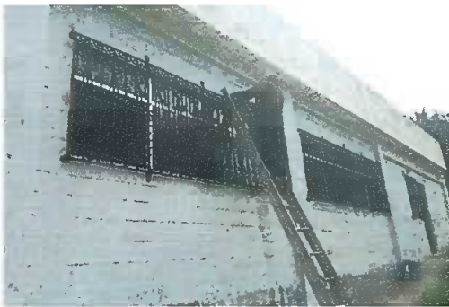
Foto 3: Modulo 1: Fabricación e instalación de balcon de hierro en ventana