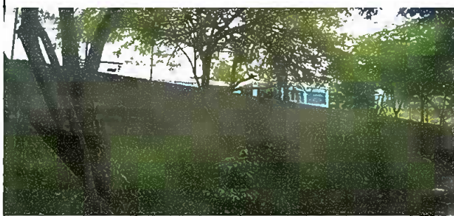
Foto 5: Modulo 2: Reparación de muro perimetral de block con tubo hg y malla galvanizada, soleras intermedias y columnas