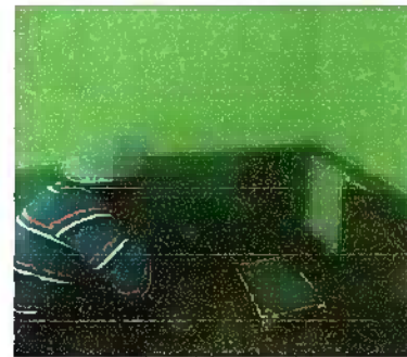
Foto 6: PINTURA GENERAL: Pintura en muros exteriores e interiores

Observación: Si es necesario se pueden agregar hojas adicionales y actualizar el número de fotos.