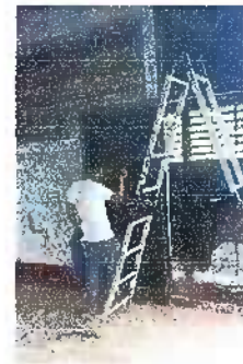
Foto 10: Modulo 2: Mantenimiento a estructura de puerta (lijado, cambio de tubo, cepillado, sujeciones, aplicación de pintura)