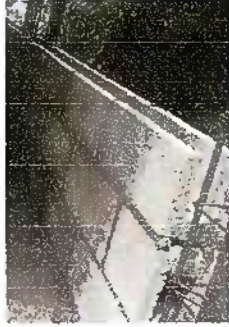
Foto 13: Modulo 4: Reparación de muro perimetral de block con tubo hg y malla galvanizada, soleras intermedias y columnas