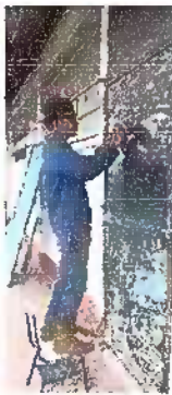
Foto 3: Modulo 1: Mantenimiento a estructura de puerta (ijado, cambio de tubo, cepillado, sujeciones, aplicación de pintura)