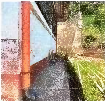
Foto 11: Modulo 2: Sustitución de bajada de agua pluvial de metal por tubo PVC 3"