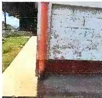
Foto 5: Modulo 1: Sustitución de bajada de agua pluvial de metal por tubo PVC 3"