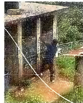
Foto 12: Modulo 3: Mantenimiento a estructura de puerta (lijado, cambio de tubo, cepillado, sujeciones, aplicación de pintura) a puertas servicios sanitarios

Observación: Si es necesario se pueden agregar hojas adicionales y actualizar el número de hojas.