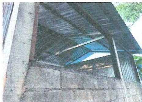
Foto 6: Sustitución de lámina por lámina troquelada calibre 26 de la cocina escolar

Observación: Si es necesario se pueden agregar hojas adicionales y actualizar el número de hojas.