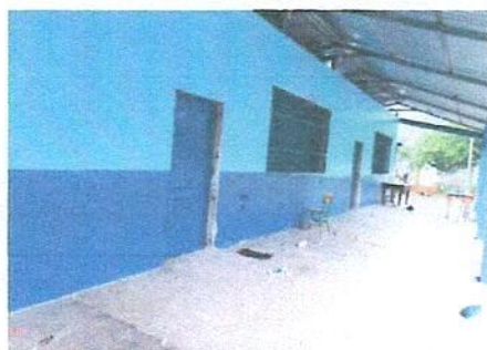
Foto 3: Pintura en muros exteriores e interiores del centro educativo