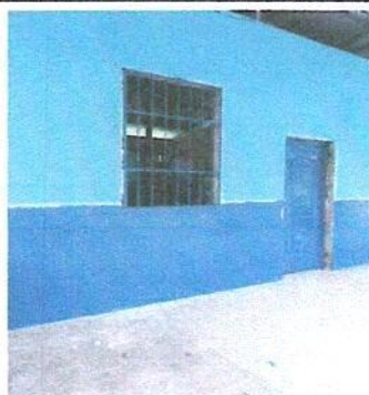
Foto 2: Sustitución de ventanas de madera con malla por balcones de metal