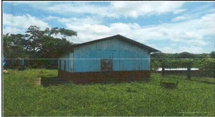
Foto1: VISTA GENERAL DE LA COCINA