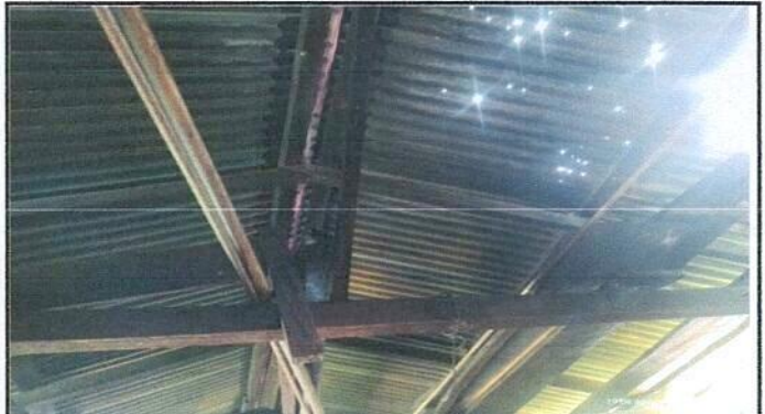
Foto 4: SUSTITUCIÓN DE ESTRUCTURA DE SOPORTE DE MADERA, POR METAL