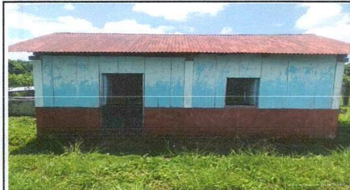
Foto 3: SUSTITUCIÓN DE LÁMINA, POR LÁMINA TROQUELADA ALUZINC CALIBRE 26