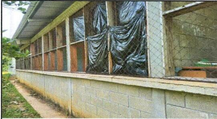
Foto1: Sustitucion de ventanas de madera por metal mas vidrio.