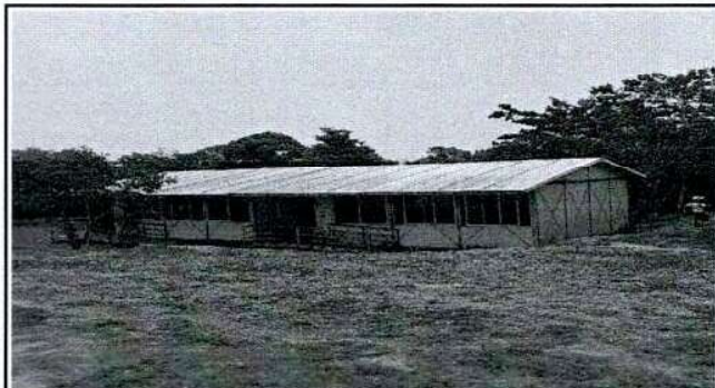
Foto 2: Aulas nivel preprimario despintadas por falta de mantenimiento