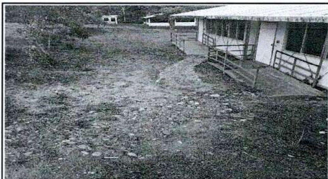
Foto 4: Patio de aulas nivel preprimario con poco material causante de accidentes en época de invierno.