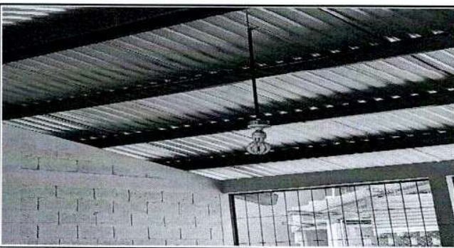
Foto 5: Sistema eléctrico en malas condiciones los materiales se han deteriorado en su totalidad por mucho tiempo de uso.