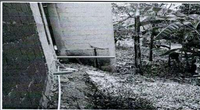
Foto 3: desague de baños lavables no utilizados por falta de fosa séptica.