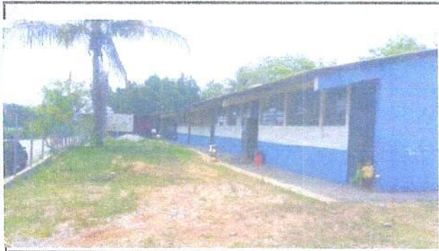
Foto1: Vista general del establecimiento.