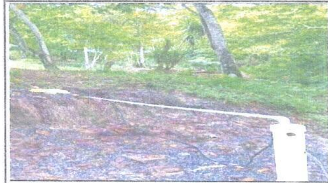
Foto 4: Sistema electrico instalado al pozo mecanizo, incluye boma sumergible.