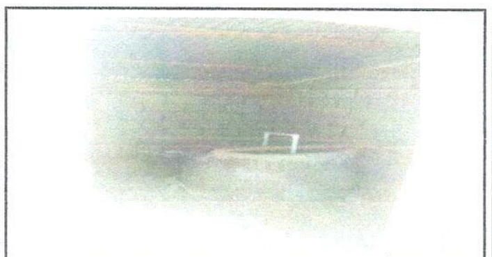
Foto 6: Es necesario intervenir el pozo para el uso de los servicios sanitarios y para el uso de la alimentación escolar, higiene y limpieza del centro educativo.

Observación: Si es necesario se pueden agregar hojas adicionales y actualizar el número de hojas.