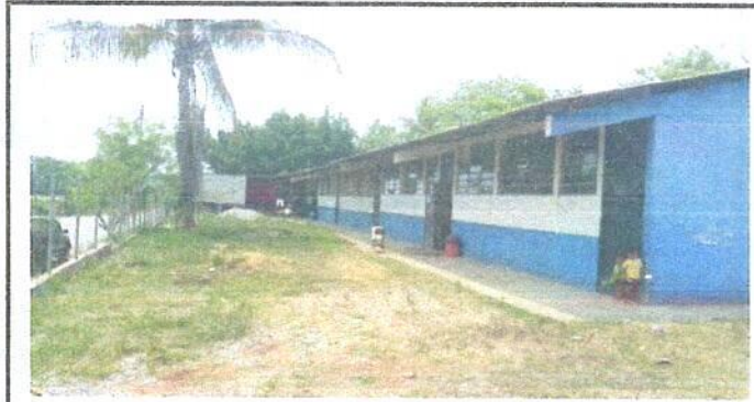
Foto1: Fotografía general del establecimiento.