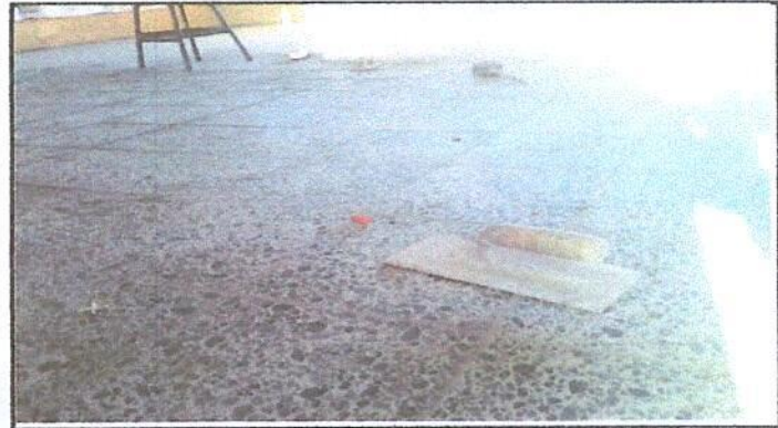
Foto 4: Reparación de piso de torta de concreto por piso de granito