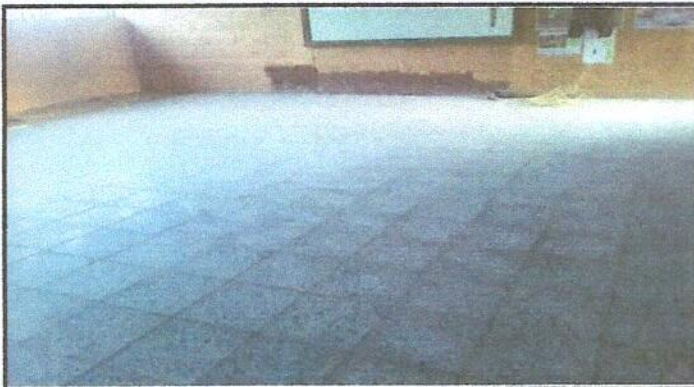
Foto 3: Reparación de piso de torta de concreto por piso de granito